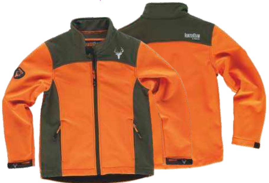
naranja a.v./verde caza

Tejido: 96% Poliéster 4% Elastano (300 g/m2)